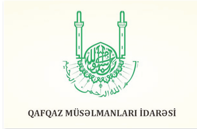
QAFQAZ MÜSƏLMANLARI İDARƏSİ

Biz, Azərbaycan müsəlmanları şükürlər edirik ki, bu il Məhərrəm ayı Qarabağ həsrətinin sonu, illər boyu dualar etdiyimiz zəfər dönməsinə təsadüf edir. Müzəffər Ali Baş Komandan, Prezident İlham Əliyevin rəhbərliyi ilə 44 günlük Vətən müharibəsində şanlı Ordumuzun bizlərə yaşatdığı qürur və sevincə görə Uca Yaradana həmd-sənalar, dövlətimizin rifahı üçün dualar edirik. İşğaldan azad olmuş ərazilərimizdə yenicən qurmanın başlanması, dini-mədəni abidələrimizin