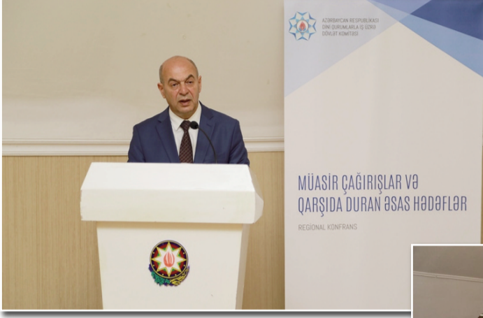
əvvəlki səh. 5

"Müasir çağırışlar və qarşıda duran əsas hədəflər" mövzusunda keçirilən növbəti üçgünlük regional konfrans 25-27 iyul tarixlərində Gəncə şəhərində baş tutub.